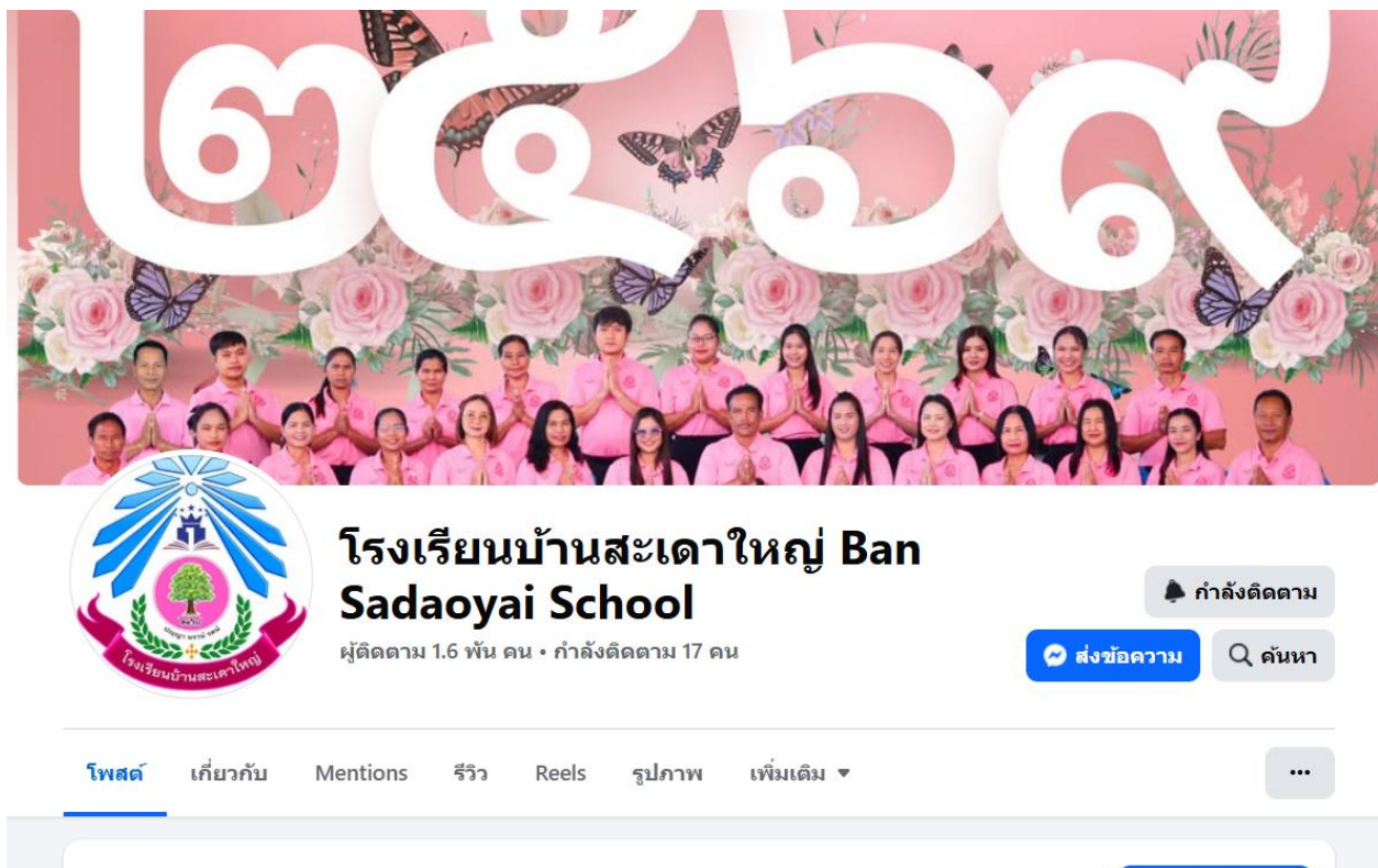
เพจบุ๊กโรงเรียนบ้านสะเดาใหญ่