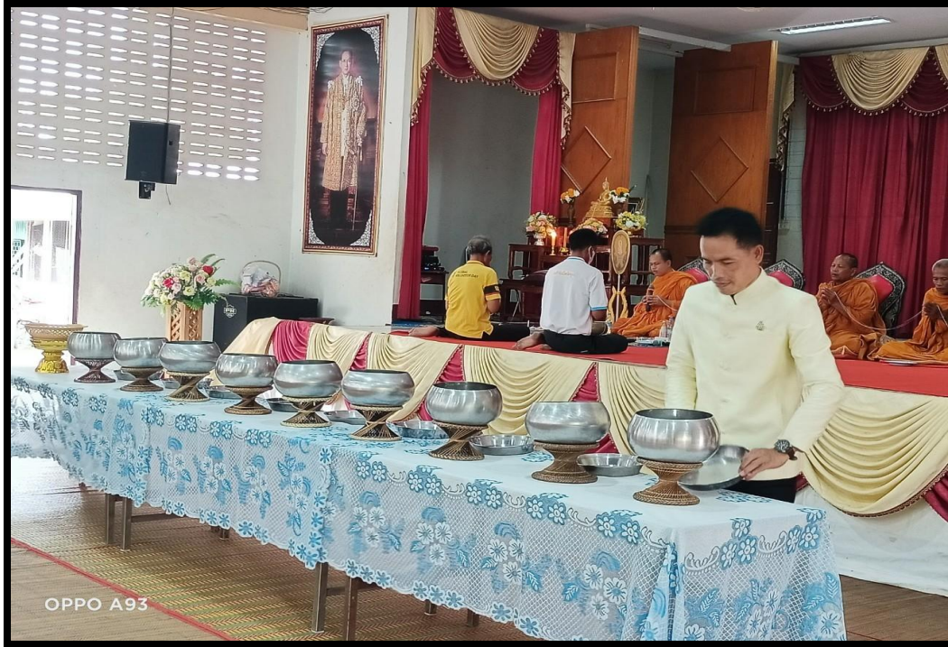
ผู้บริหารสถานศึกษา คณะครู บุคลากร ผู้ปกครอง และนักเรียน ร่วมกันใส่บาตร