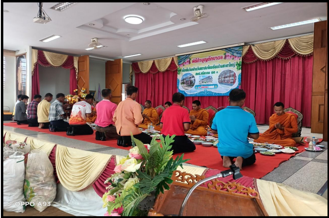
ผู้ปกครอง ชุมชน ร่วมถวายภัตตาหารเพล และจตุปัจจัยแด่พระสงฆ์ เป็นเสร็จพิธี