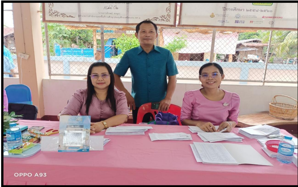
คณะครู บุคลากร ผู้ปกครอง และนักเรียน ร่วมกัน ณ หอประชุมโรงเรียนบ้านสะเดาใหญ่