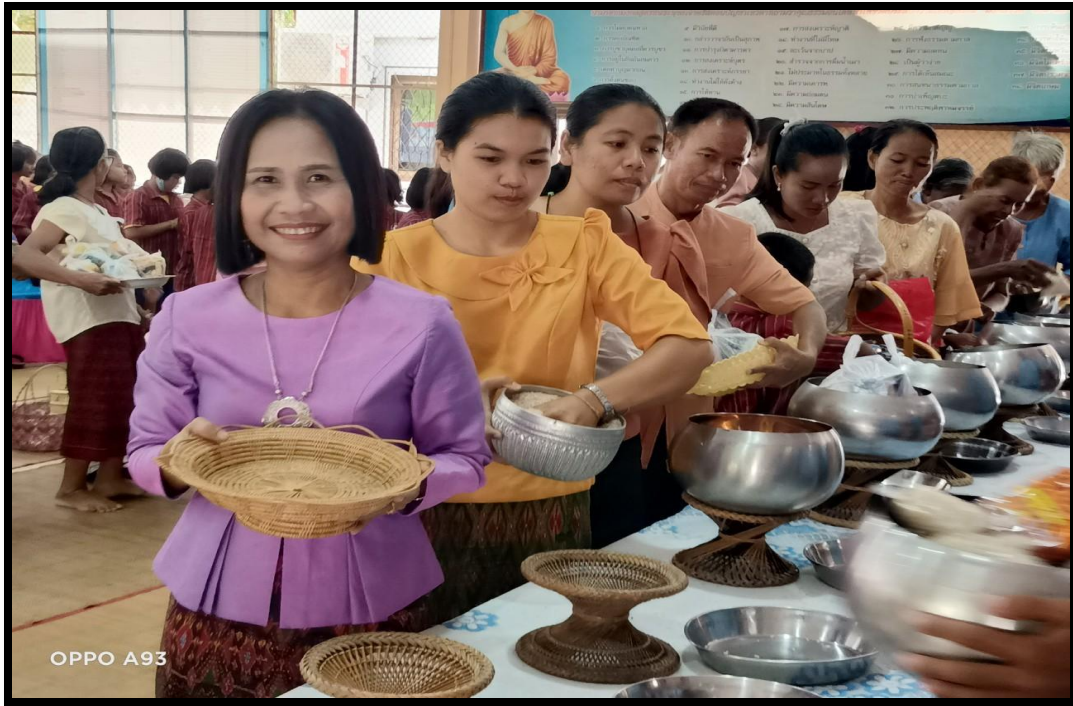
ผู้บริหารสถานศึกษา คณะครู บุคลากร ผู้ปกครอง และนักเรียน ร่วมกันใส่บาตร