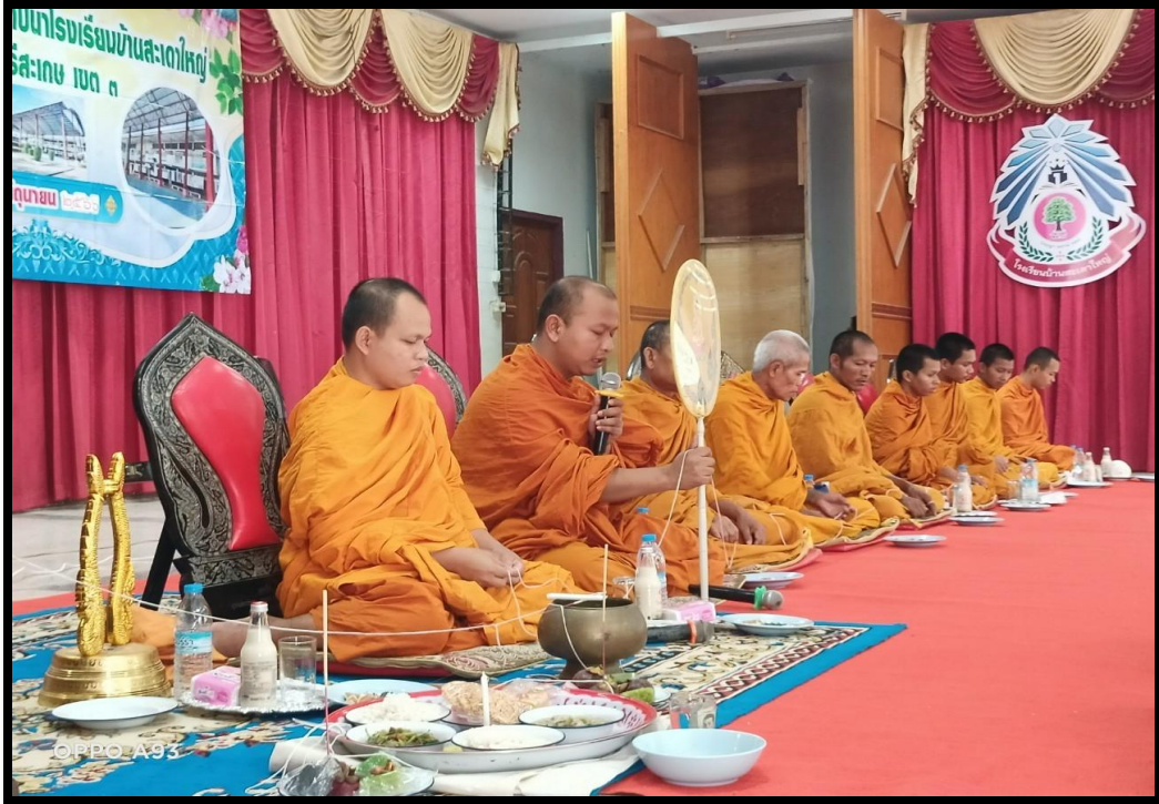
พระสงฆ์เจริญพระพุทธมนต์ ก่อนทำพิธีตักบาตร