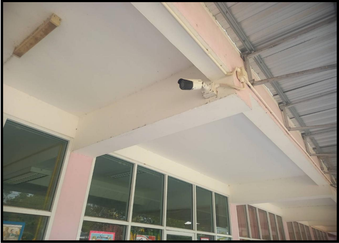
ระบบกล้องวงจรปิด