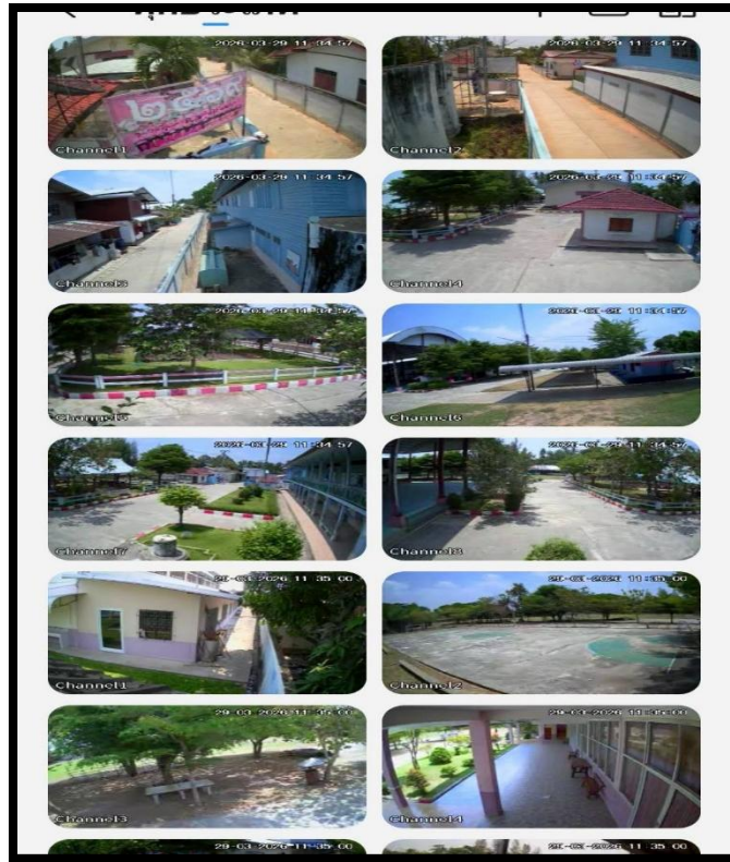
ระบบภาพจากกล้องวงจรปิด